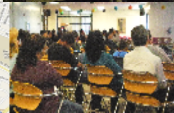
Tri-C SSC, ELAC, and CEAC election