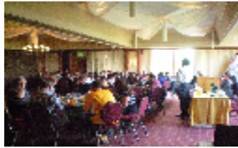
CHS/Tri-C en el Entrenamiento.