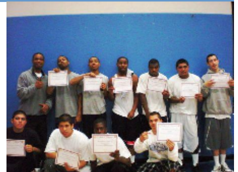
El equipo de Leimert Park de Central-High/Tri-C gano el campeonato del torneo anual de baloncesto de 2009.