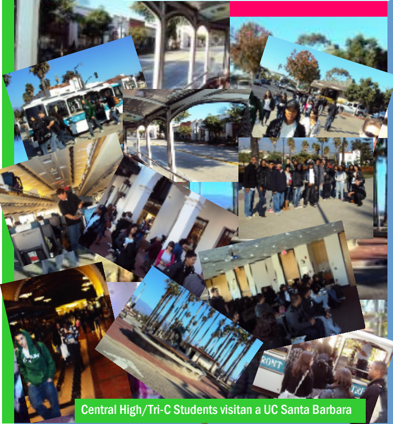
Central High/Tri-C Students visitan a UC Santa Barbara