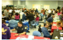
Estudiantes de Central

Los estudiantes de la escuela Preparatoria Central y CDS Tri-C asistieron a la Feria de Colegio y Carrera de 2009 en el Centro Ocupacional Abram Friedman, 1646 S. Olive St., Los Angeles CA el 5 de Noviembre del 2009. Representantes de más de 25 Colegios y Universidades, negocios locales y fuera del estado y agencia gubernamentales presentaron sus programas en la feria. Estudiantes de todas las clases